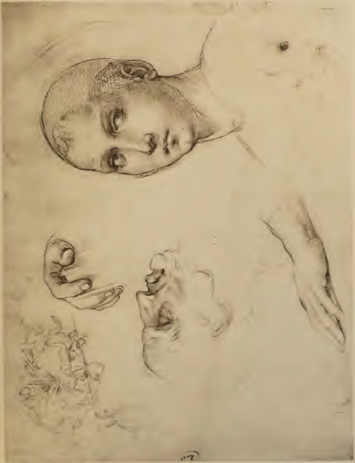
Étude pour la tête de Saint Benoît — A gauche, étude de mains, tête de vieillard de profil, dans les coins esquisses pour la bataille d'Anghiari